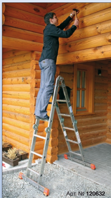
Арт. № 120632