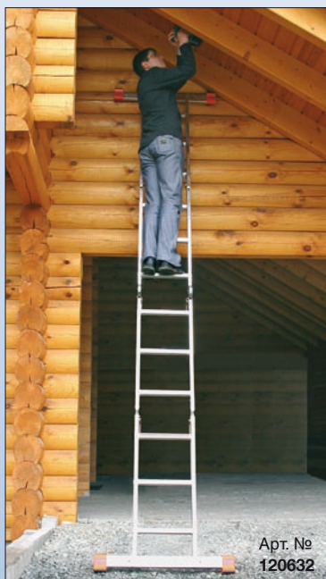
Арт. № 120632