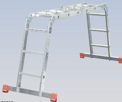
Арт. № 120632