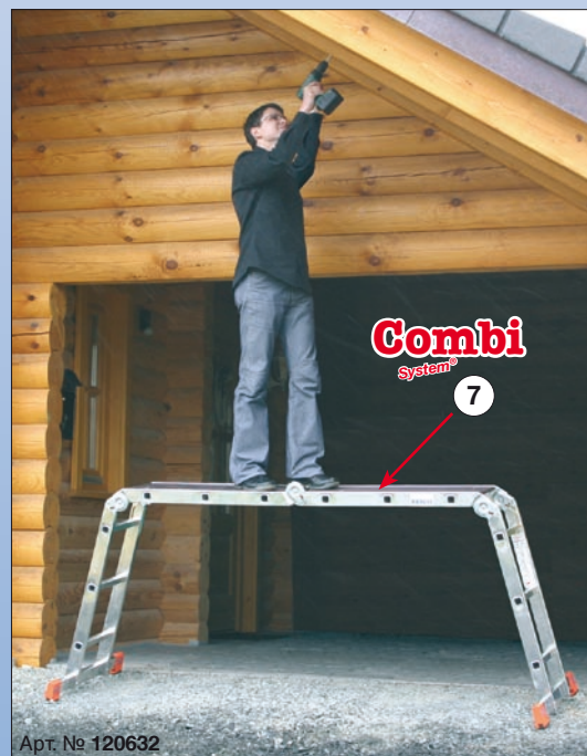
Арт. № 120632